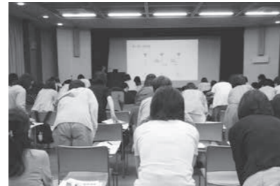
様々な動きを体験しました