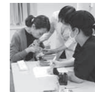
角度に気をつけて

と各種機器の使い方の実習」を行いました。先生方からの丁寧な指導により、しっかりと手技を習得した2時間でした。受講者の皆様からは終了後のアンケートで好評を得る感想がたくさんありました。