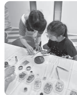
デコ歯ブラシを作ろう!