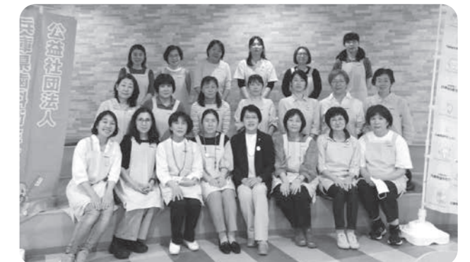
但馬支部と普及啓発委員会の皆さん