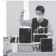
賛助会員の情報提供

午後からのリーダー研修会は「10年後を見据えて、今できること」をテーマに①会員拡大②人材育成③緊急時の対応についてグループワークを実施しました。