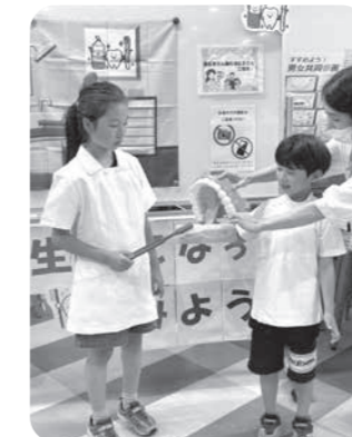
歯科衛生士になってみよう